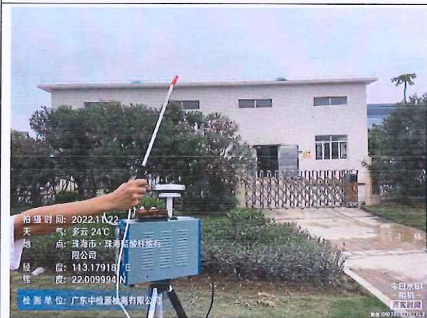
无组织废气下风向监控点 3#