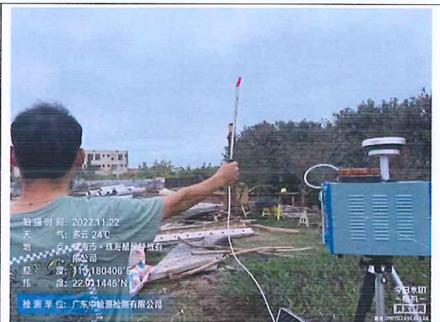
无组织废气下风向监控点 2#