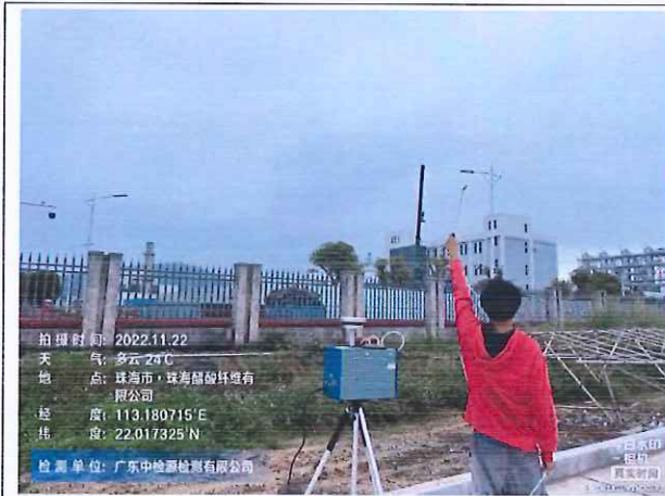
无组织废气上风向参照点 1#